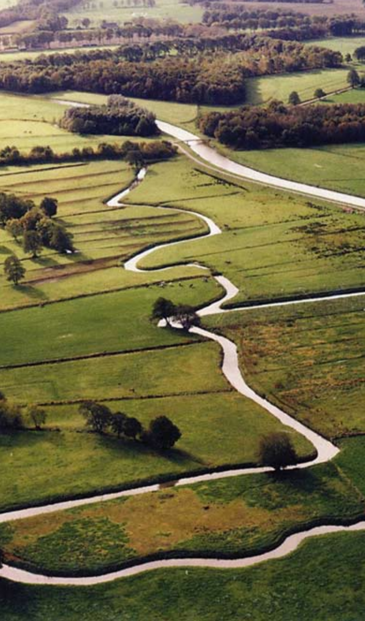
Typisch Nederlands landschap Typical Dutch landscape