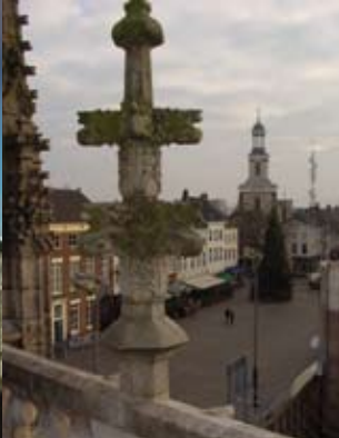
Kruisbloem kooromgang, Onze Lieve Vrouwekerk, Breda Finial, Our Lady's Church, Breda