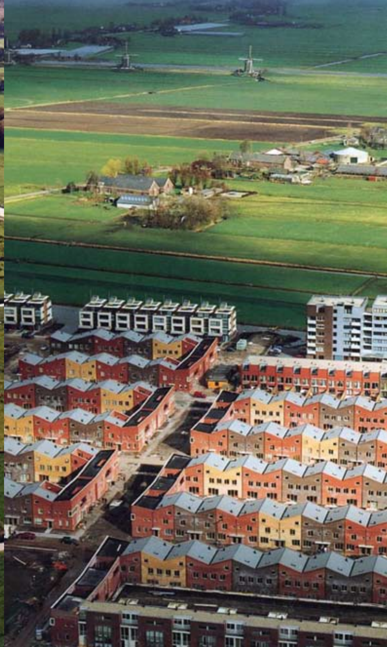
Recente transformaties van het Nederlandse landschap door de bouw van Vinexwijken Recent transformations of the Dutch landscape owing to the construction of Vinex suburbs