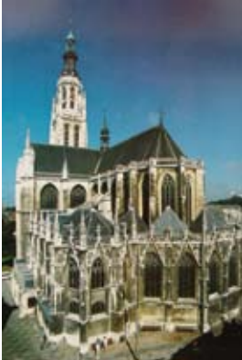
Onze Lieve Vrouwekerk, Breda Our Lady's Church, Breda